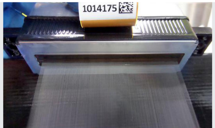
*Cortina después de la limpieza

*No todos los cabezales admiten la aplicación de cortina