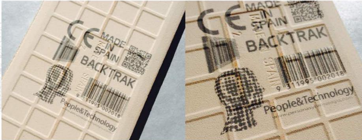
Detalle de impresión realizada con BACKTRACK, en la parte trasera de un azulejo.